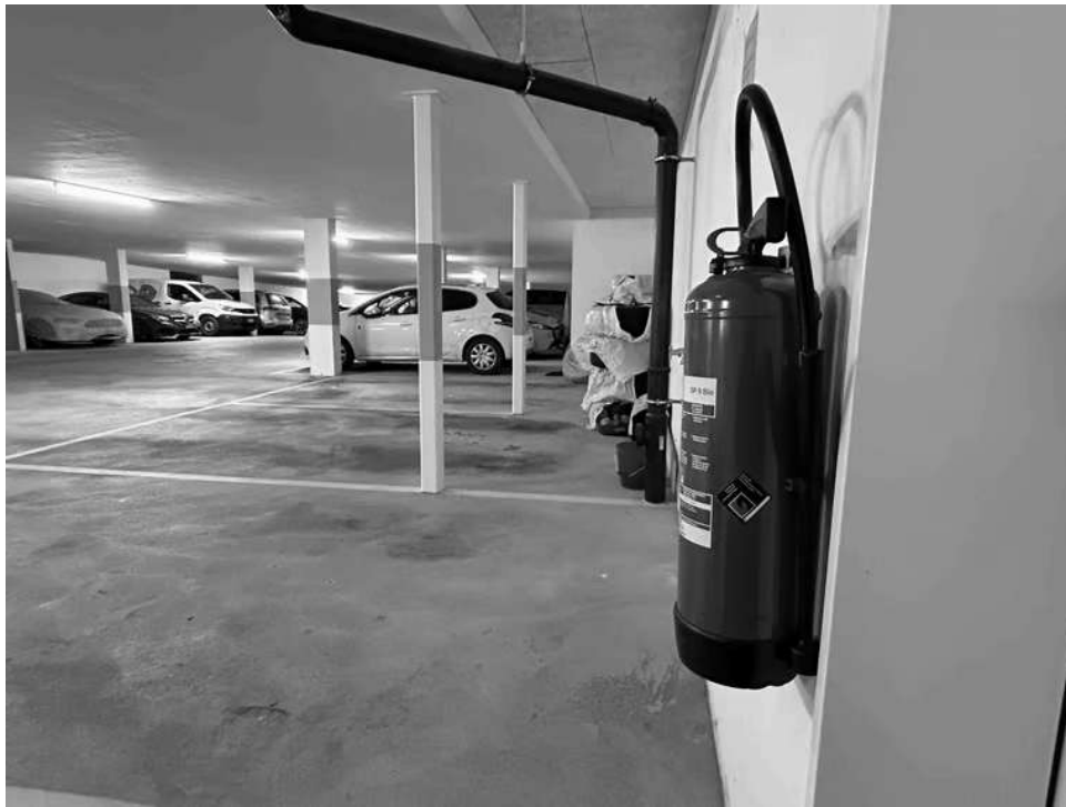
Feuerlöscher in der Tiefgarage an der Myrtenstrasse: Nach wie vor bestehen einige Brandschutzmängel.