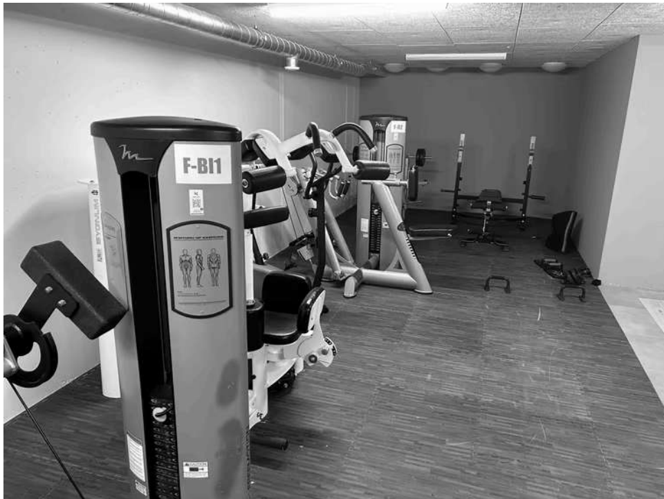
Fitnessgeräte gammeln im Luftschutzkeller vor sich hin.

Es weist auf die Frist zur Mängelbehebung von zwei Monaten hin. Passiert ist seither nichts, wie sich vor Ort zeigt. Stattdessen stehen reihenweise Fitnessgeräte im Luftschutzkeller herum. Im Notfall wäre dieser nutzlos.